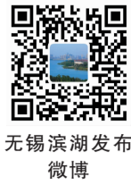
无锡滨湖发布 微博