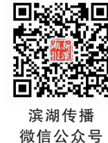
滨湖传播 微信公众号